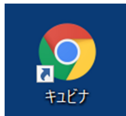
デスクトップ上のアイコン

起動すると、下のような画面が表示されます。画面左の「ホーム」をタップし、教科を選んでタップします。オレンジの枠は例を示しています。