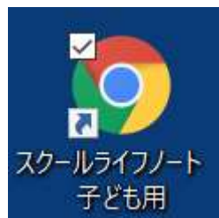
デスクトップ上のアイコン